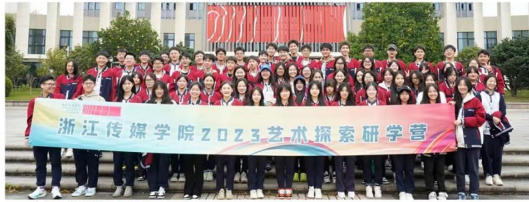
2023年第三期传媒艺术探索研学营合影