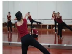
舞蹈编导专业名师指导